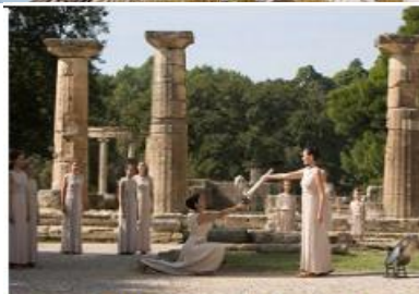
Stara Olimpija, hram Here - paljenje plamena