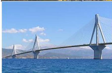
Korintski zaliv, most Rio -Antirio