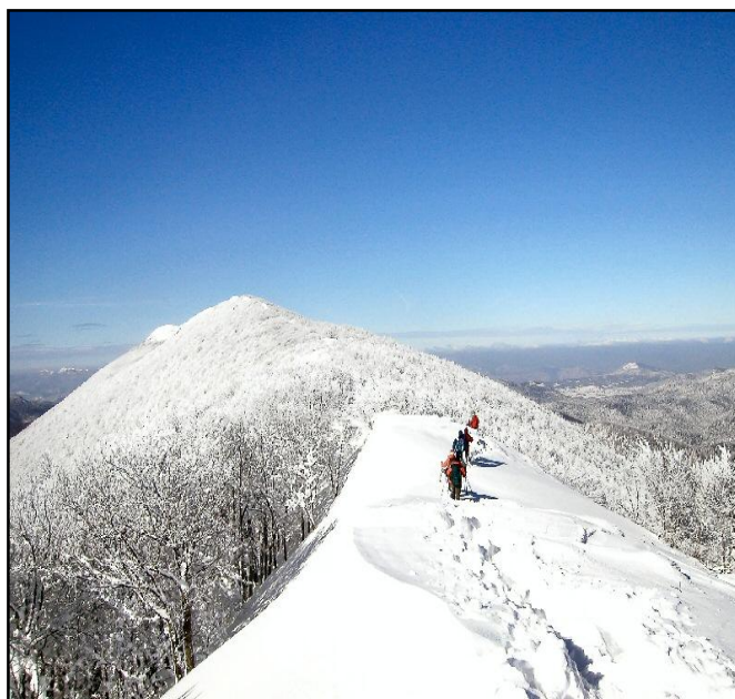
Po snježnom grebenu Bjelolasice

06.45 Okupljanje iza KD Vatroslav Lisinski 07.00 Polazak autobusa prema Mrkoplju 09.00 Dolazak autobusa u Begovo Razdolje (ili alternativno Tuk) 09.15 Polazak na uspon 12.15 Dolazak na vrh Bjelolasice – razgled i okupljanje za povratak 12.30 Povratak preko skloništa Jakob Mihelčić 13.00 Dolazak u sklonište (neopskrbljeno), pauza okrijepa iz ruksaka 13.30 Povratak u Begovo Razdolje 16.00 Dolazak u Begovo Razdolje, okrijepa 17.30 Polazak za Zagreb 20.00 Dolazak u Zagreb