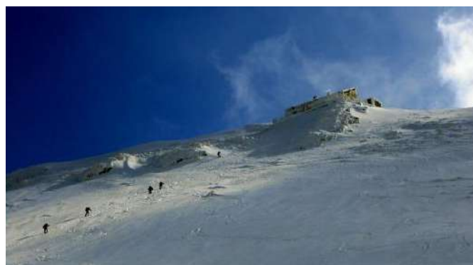
Završni uspon na zavetišće pod Snežnikom

Veliki Snežnik je najviši ne alpski vrh u Sloveniji koji se nalazi u blizini granice Slovenije i Hrvatske. Planina se za antike zvala Mons Albius (Bijela planina). Veliki Snežnik je ujedno i najviša točka Via Dinarica staze u Sloveniji. Sam vrh je gola glava s kojeg se pogled pruža u svim smjerovima, pa je tako za lijepog vremena moguće vidjeti Julijske Alpe, Kamničko Savinjske Alpe, te Karavanke, kao i veći dio Gorskog Kotara, Istre i Kvarnera. Na samoj planini Snežnik izvire 5 rijeka: Pivka, Reka, Čabranka, Kupa i Rječina.