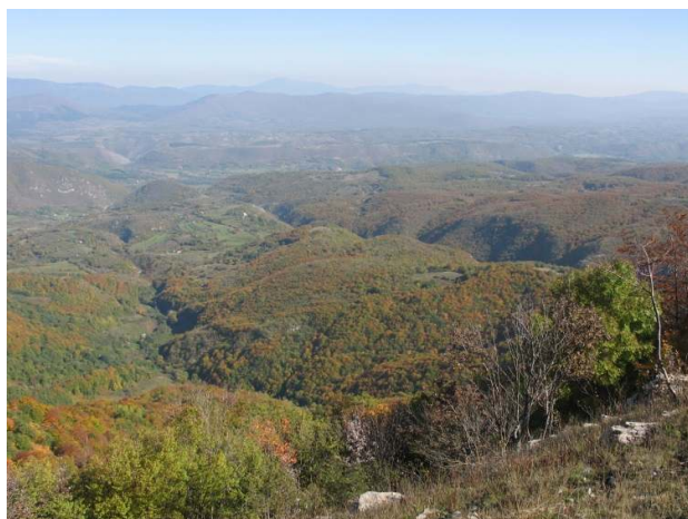
Pogled sa Ravne Čemernice prema BiH

Geološke zanimljivosti područja Mazinske planine i vrelo Une su brojne: od razolikih vrsta stijena koji diktiraju specifični reljef ove planine, preko pojava gipsa, sve do vrlo dubokog rasjeda (pukotine) u zemljinoj kori koji se nastavlja kroz dolinu Zrmanje preko Kina i dalje na jug, a uz kojeg je vezan i nastanak vrelo Une.