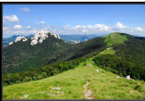
pogled s Budakovog brda