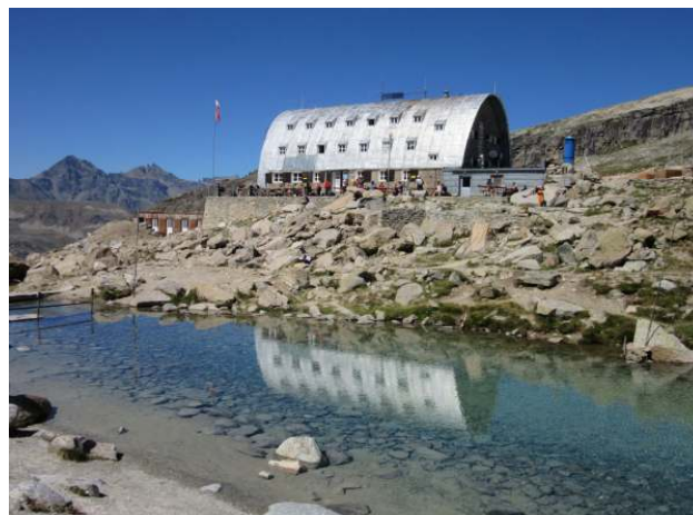
Pl. dom Vittorio Emanuele II