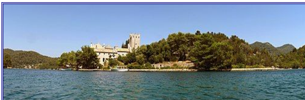
otok -Sv. Marije

Napomena: Odazivom na izlet svaki pojedinac potvrđuje da ispunjava zdravstvene i psihofizičke uvjete za sigurno sudjelovanje na izletu, da izletu pristupa na osobnu odgovornost te da će se u skladu s planinarskom etikom pridržavati plana izleta, odluka i uputa vodiča. Vodič ima pravo izmjene programa izleta s obzirom na objektivne okolnosti na terenu.