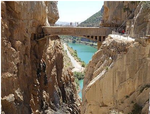
Caminito del Rey

četvrtak – subota, 15.-24. kolovoz 2024. godine