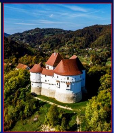
simbol zagorja Veliki Tabor