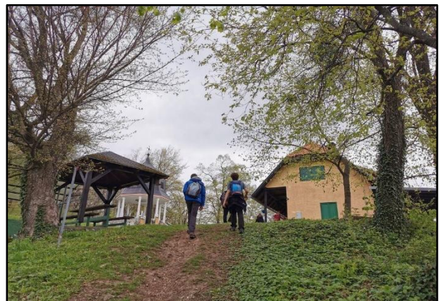
Planinarska kuća Kunagora