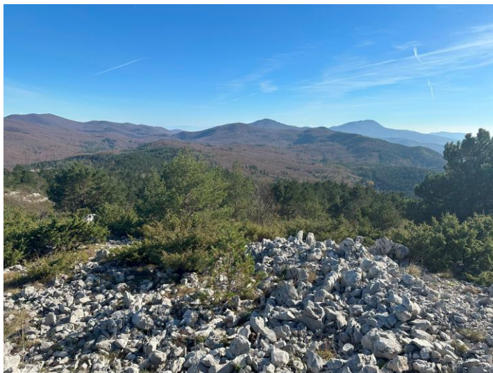
Pogled s Orljaka prema Velikom Planiku i Vojaku