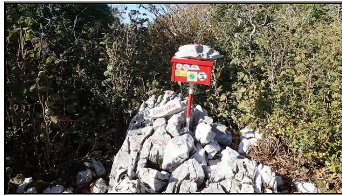
Crni vrh