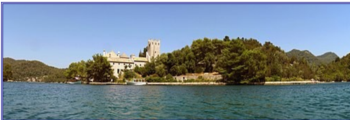
otok Sv. Marije