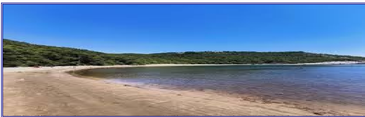
plaža Limuni u Saplunari