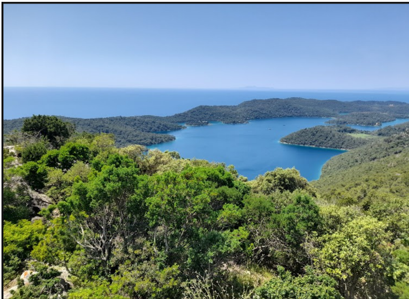
pogled na jezera