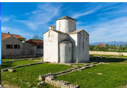
Nin - Sv. Križ