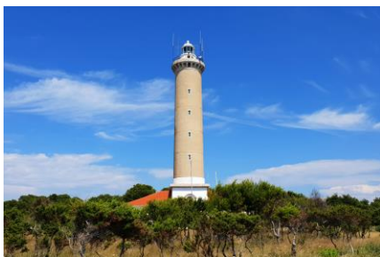
svjetionik Veli Rat