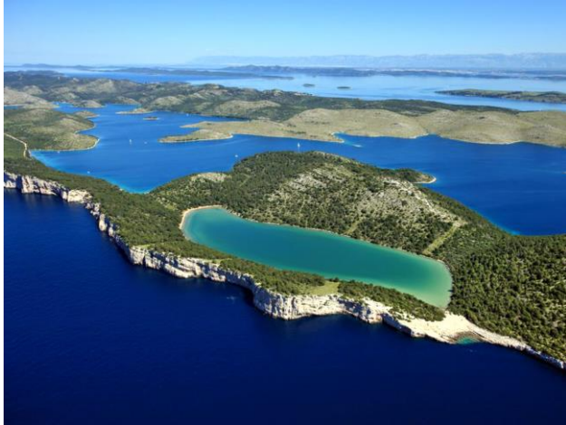
Dugi otok – slano jezero Mir

subota - petak, 7. – 13. lipnja 2025. godine