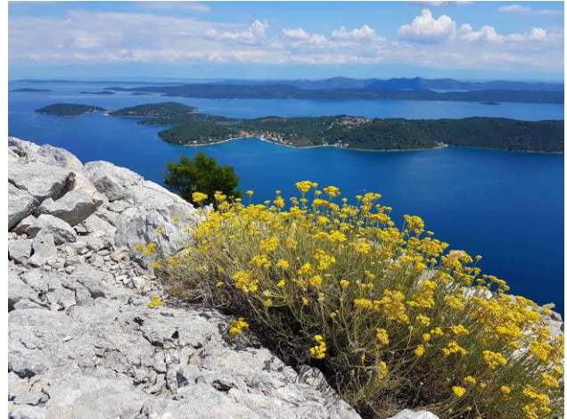
pogled s vrha Orljaka