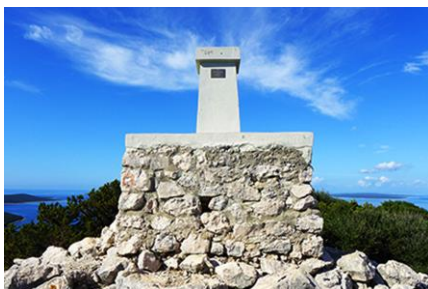
otok Ist – vrh Straža

Slobodno prijepodne do polaska trajekta Brbinj – Zadar Gaženica. Trajekt isplovjava u 12:00 sati, a u Zadru smo u 13:40 sati. Slijedi vožnja do Nina i razgled gradića pa kasni dodatni ručak. Povratak za Zagreb se planira oko 18:00 sati s predviđenim dolaskom do 21:00 sat.