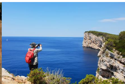
PP Telašćica