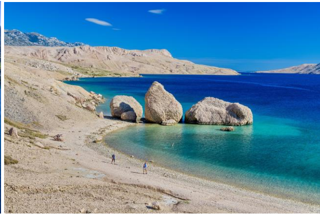
Pag: staza Life on Mars