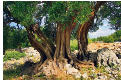
Lunski maslinici