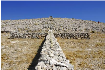
Branimirov križ