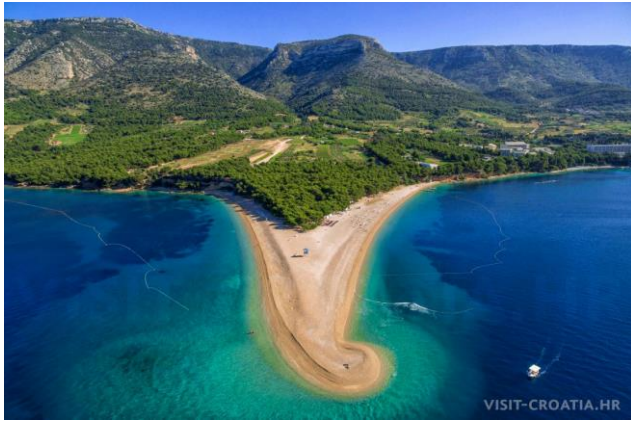
Brač: Zlatni rat i Vidova gora

petak - petak, 1. – 8. svibnja 2026. godine