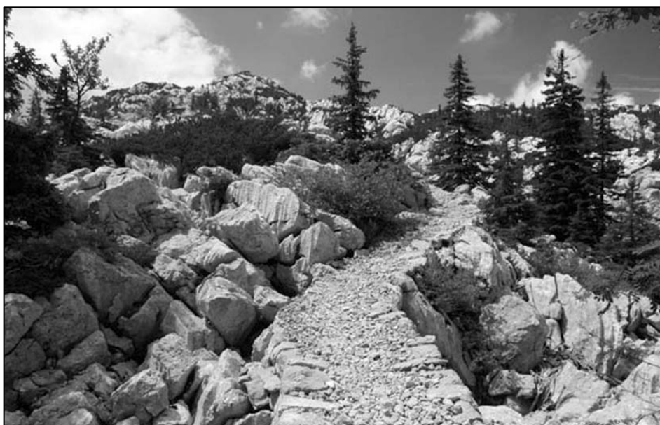
Sl 1.-2. Premužičeva staza