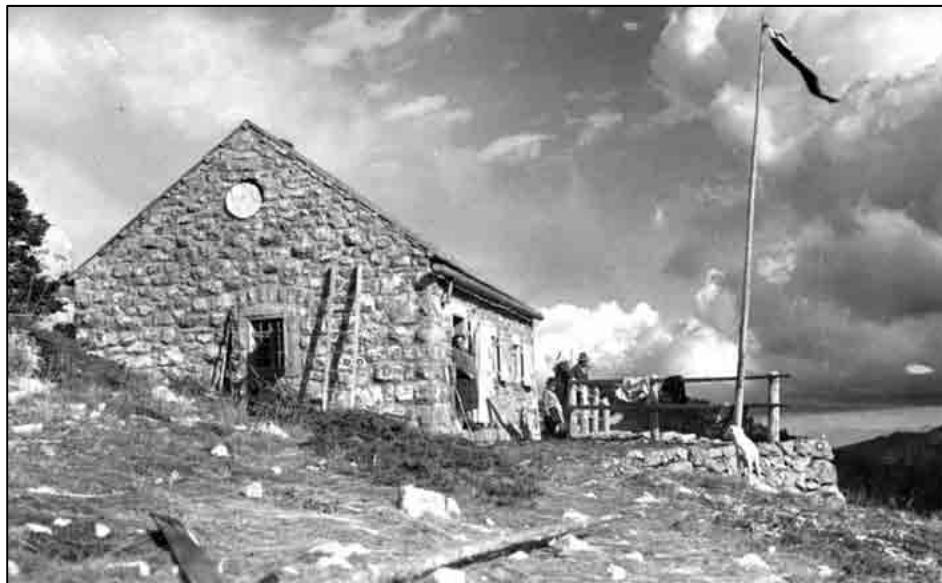
Sl. 5. Krajačeva kuća

veze). Još ilustrativniji je primjer da sam 1959. kao urednik planinarskog časopisa morao iz bibliografije 1898-1958. izbaciti članke politički nepoćudnih osoba. Među njima bilo je najviše Krajačevih, pa tako i svi njegovi članci o Premužićevoj stazi. Na moj prigovor da su to ključni članci bez kojih je bibliografija bezvrijedna, postignut je kompromis: naslovi članaka mogu biti uvršteni ali ne i imena njihovih autora. Zavrjeđuje da se citira bilješka koja je o tome objavljena u broju 1-2, 1959. str. 2.: "Redakcioni odbor "Naših planina" donio je odluku da se iz ovog pregleda izostave ratni brojevi "Hrvatskog planinara" (1941-1944) koji sadrže 90 članaka. Osim toga je iz predratnih godišta eliminirano 12 autora (sa 18 članaka), koji su se kompromitirali ili bili osuđeni od Narodnih sudova." Danas više nema zapreke da obnovimo sjećanje na Krajača, tim više što je u svoje doba bio istaknuta ličnost hrvatske kulture. O toj planski zanemarivanoj, ali zanimljivoj i osebujnoj ličnosti, napisao je planinar, glumac i publicist Vladimir Jagarić (1925-2011) knjigu Ivan Krajač – Život i djelo političara, ekonomista, pravnika i planinara koju je 2009. tiskao Hrvatski planinarski savez. Ona sadrži i izbor Krajačevih tekstova, tako da će je svatko tko se zanima za hrvatsku povijest između dva svjetska rata sa zanimanjem pročitati jer je temeljito dokumentirana a usto pisana na vrlo čitak način.