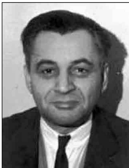
Sl. 6.. Viktor Ružić

Za izgradnju Staze velike zasluge ima i dr. Viktor Ružić (1893-1976), sušački odvjetnik, ban Savske banovine i ministar pravde u jugoslavenskoj vladi 1939. Zahvaljujući svojim funkcijama i postignutom ugledu mogao je osigurati dio novčanih sredstva za izgradnju Staze, čime je ujedno osigurao prihode stanovnicima velebitskog podgorja za vrijeme gladi (Savska banovina je doznala 30.000 dinara kad je izgradnja Staze zapela zbog nestašice novaca). Snažno je podupirao i planinarsko društvo Velebit na Sušaku koje je njegovom zaslugom 1935. sagradilo prvi planinarski dom na Platku iznad Rijeke. Njemu u čast i u znak zahvalnosti Velebit ga je nazvao Ružićev dom (izgorio je 1938.).