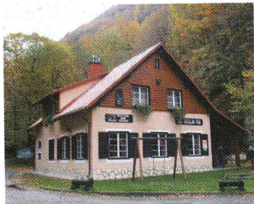
Izletnički dom »Zeleni vir«

Od Zelenog vira treba se vratiti na križanje iz Skrada, i nastaviti ravno silaziti 10 min do munjare i izletničkog doma »Zeleni vir« uz koji je ulaz u Vražji prolaz.